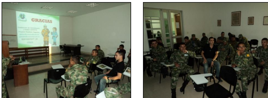
Ilustración 10. Registro fotográfico capacitación en RESPEL