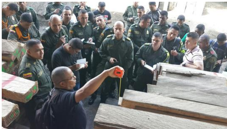
Ilustración 1: Capacitación Fuerza Publica