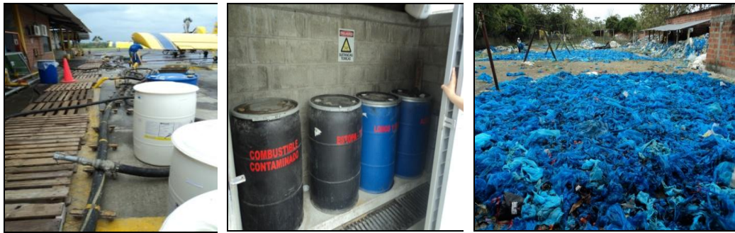
Ilustración 9. Registro fotográfico de visitas realizadas.