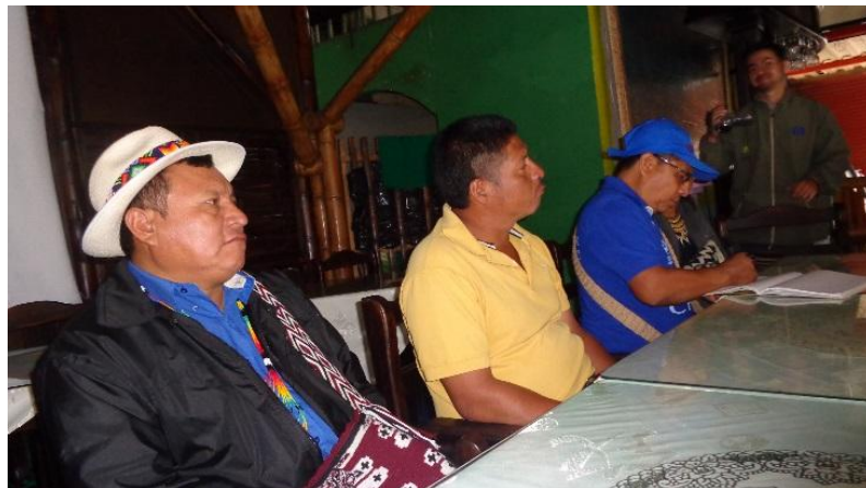
Ilustración 3: Encuentro con líderes indígenas del Eje Cafetero