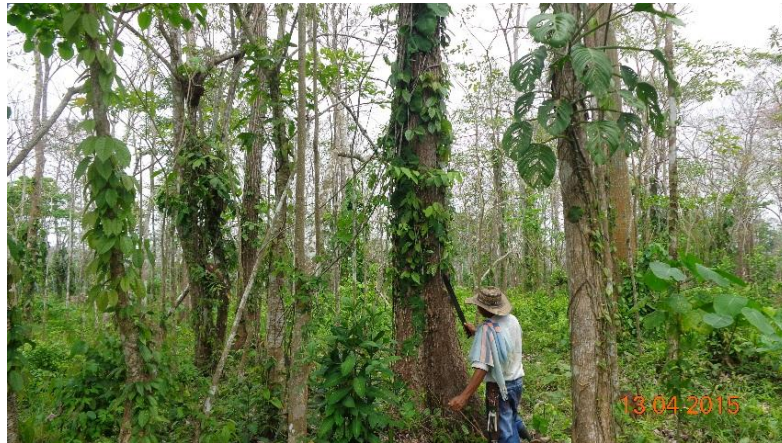
Ilustración 4: Bosque en manejo Comunidad Indígena de Caimán Nuevo