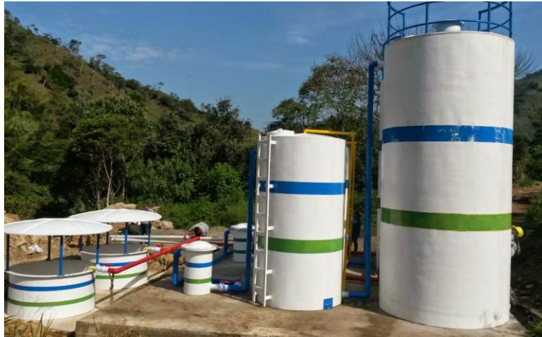
Ilustración 7. PTAR Construida en el Barrio La esperanza del Municipio de Cañasgordas con recursos del FRDH