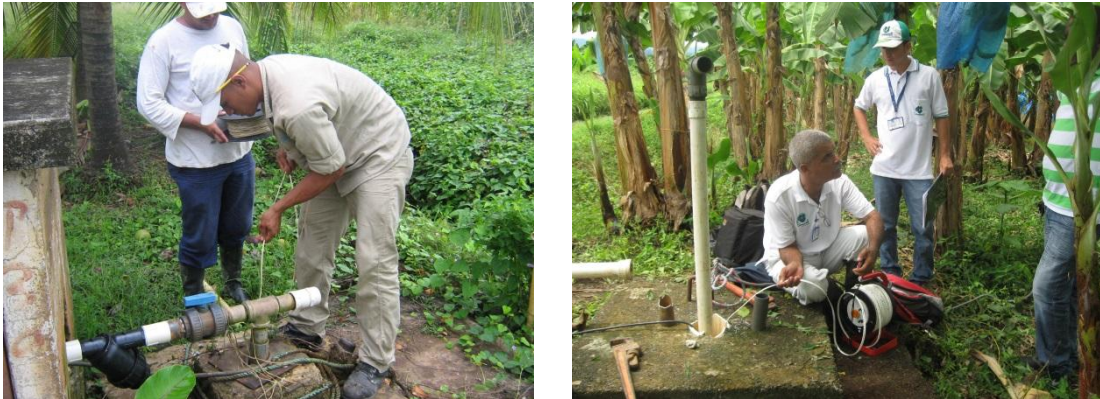
Ilustración 5. Medición de niveles piezométricos