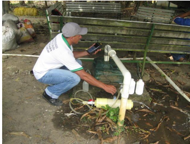
Ilustración 6. Medición de niveles piezométricos