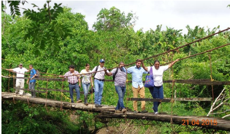
Ilustración 2: Salida de Campo con representantes de sectores ambientales de Panamá y WWF