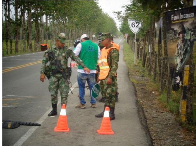
Ilustración 11: Control Forestal en Semana Santa